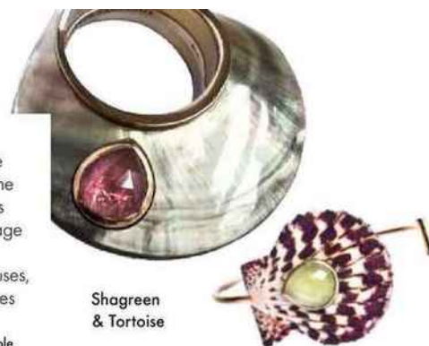
Shagreen & Tortoise

Marie-Hélène Loubrielle sélectionne de beaux coquillages et les transforme pour nous en bijoux ultraraffinés, sous sa griffe Shagreen & Tortoise. À l'image d'un oursin monté en bague ornée de cristaux et de pierres semi-précieuses, ces fruits de mer deviennent des pièces baroques, uniques et organiques. En vente chez Hod, 104, rue Vieille-du-Temple (3 e ). shagreen-et-tortoise.com