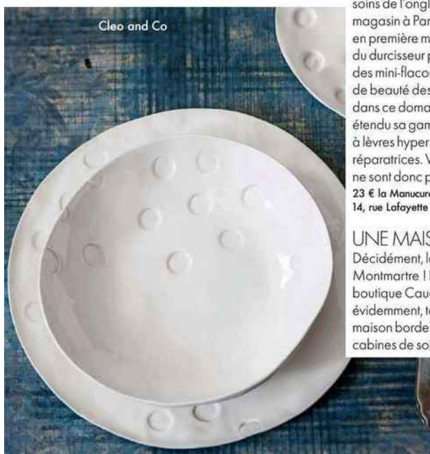
Cleo and Co

En face de Cleo C, sa boutique de tissus d'ameublement, Cléo Carnelli vient d'ouvrir Cleo and Co pour mettre en valeur les créations artisanales de l'une de ses marques chouchoutes, la maison italienne Bertozzi. Vaisselle, linge de lit, linge de table, rideaux découpés dans de beaux lins et cotons... Chaque pièce est imprimée à la main au tampon de bois