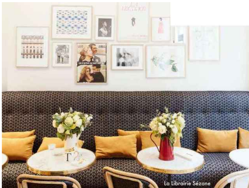
La Librairie Sézane