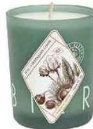
Bougies La Française