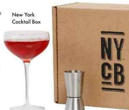
New York Cocktail Box

Et si on profitait des longues soirées d'hiver pour s'initier à la mixologie ? On file sur le Web s'offrir la New York Cocktail Box, avec ou sans abonnement. Ce kit clé en main renferme tous les ingrédients, les ustensiles et les instructions nécessaires pour réaliser le cocktail signature d'un bar new-yorkais, pour quatre personnes. Ce mois-ci, le bar Brandy Library ( brandylibrary.com ) livre les secrets du manhattan, à base de bourbon, vermouth et bitter. So winter ! 26,90 € ou 29,90 €. newyork-cocktail-box.com