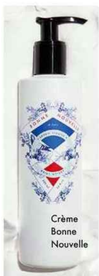
Crème Bonne Nouvelle

Quoi de plus joli que Bonne Nouvelle, la nouvelle ligne de soins du corps imaginée par Adrien Gloaguen, créateur des hôtels Paradis et Panache ? Estampillés du nom d'un quartier parisien populaire, les produits combinent formulation grasse et parfums réjouissants : baies noires ou verveine tabac pour le savon liquide ou le soin du corps, coriandre pour le shampooing (19 € les 300 ml)... On aime aussi la bougie parfumée verveine tabac (40 €). À partir de 19 €. www.bonnenouvelle.paris